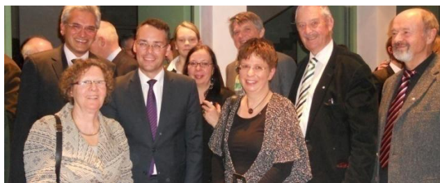
Nemeckí partneri projektu, Podunajská kancelária Ulm v „Podunajskom salóne“ na výstave ITB.

Na najväčšej výstave cestovného ruchu na svete, ITB (Internationale Tourismus Börse) v Berlíne reprezentovali TRANSDANUBE partneri projektu, a to Podunajská komisia pre cestovný ruch, Podunajská kancelária Ulm a Podunajské kompetenčné centrum Belehrad.