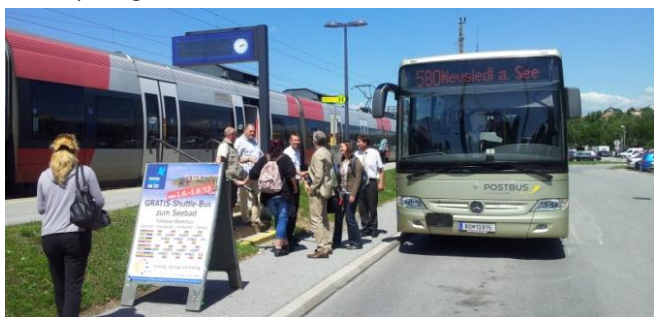
Priamy prestup z vlaku na autobus v Neusiedl am See, Rakúsko

Ako implementovať udržateľnú mobilitu v cestovnom ruchu? Dunajské kompetenčné centrum (IPA PP1) zozbieralo príklady vhodných postupov, ktoré boli implementované v dunajskom regióne i mimo neho počas predchádzajúcich rokov. Analýza týchto príkladov vhodných postupov jasne poukazuje na komplexnosť takýchto projektov, ktoré si vyžadujú komplexné riešenia a dobrú koordinovanosť na medzisektorovej úrovni, najmä medzi aktérmi z oblasti prepravy a cestovného ruchu, potrebu integrovať udržateľnosť na strategických úrovniach, ako sú plány cestovného ruchu a regionálneho rozvoja, zvyšovanie povedomia verejnosti i návštevníkov a dôležitosť finančných schém na iniciovanie a implementáciu udržateľnej mobility v regiónoch.