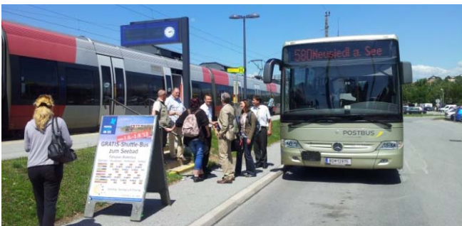
Direktumstieg vom Zug zum Bus in Neusiedl am See, Österreich

Wie implementiert man nachhaltige Mobilität im Tourismus? Das Donau-Kompetenzzentrum (IPA PP1) und weitere Projektpartner haben gute Praxisbeispiele gesammelt, die in den letzten Jahren in der Donauregion und im weiteren Umkreis bereits umgesetzt worden sind. Eine Analyse dieser guten Praxisbeispiele zeigt deutlich die Komplexität solcher Projekte, die - insbesondere im Verkehrs- und Tourismusbereich - komplexe Lösungen und eine gute Koordination auf branchenübergreifender Ebene, die notwendige Eingliederung der Nachhaltigkeit in die strategische Ebenen, vor allem im Tourismus oder in die regionalen Entwicklungspläne, die Bewusstseinsförderung sowie Sensibilisierung der Öffentlichkeit und der Gäste sowie die Bedeutung der Schaffung von Finanzierungsmaßnahmen benötigen, um eine nachhaltige Mobilität in den Regionen umzusetzen und voranzutreiben.